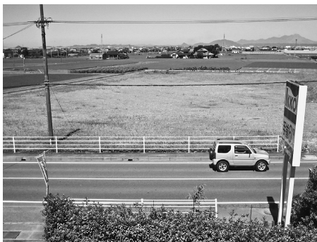
国道3号線沿いの建設予定地

町長 氷川警察署の移転につきましては、平成13年度に6300㎡の移転用地が確保されて、すでに整地が終わっています。その後なかなか移転されていないということ、当然地元といたしましても新しい警察署新築移転の建設につきましては、早く移転をしてほしいと願っているところです。そういったものを受けまして、昨年21年3月27日に氷川警察署新