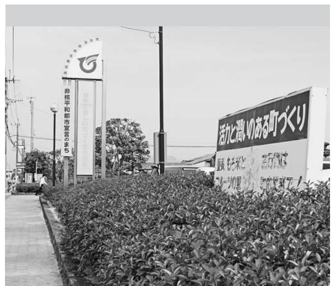
まちづくりの看板 (庁舎前)

営況等々を考えますと、大変厳しいものがあるなというところは私自身も自覚しておりますし、認識を持っていて、そういう中