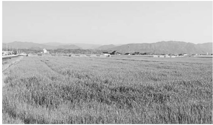
町内に広がる農地

農業振興と営農組織の育成ですが、2月に北海道に研修に参りました。あの広い土地を利用した農業の実