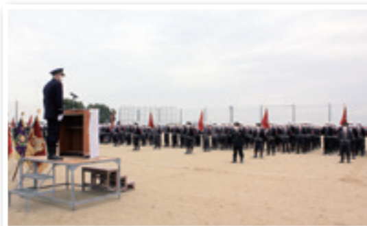
1/15 氷川町消防団出初式(竜北グラウンド)