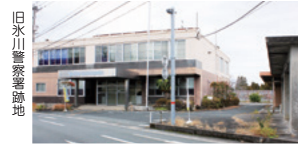
旧氷川警察署跡地

後日、宮原地区在住の議員会議が開かれ、そこでも、マンションのスケール、駐車場の確保、出入りの安全対策、日影の問題、民間とタイアップして建てるメリット、国からの特別な助成事業であるなどを共通理解する事が出来ました。