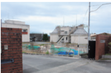
竜北西部学童保育所(後方は西部小学校)