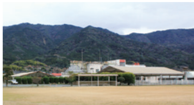
宮原浄化センター

下水道事業に地方公営企業法第2条第2項の財務規定等を適用するため、条例を制定しました。