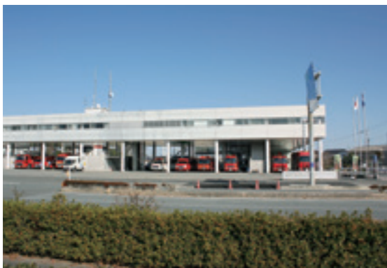
八代広域行政事務組合本部

職員の定年引上げに関するもので、国家公務員を基準として定年の段階的引上げ等を行うものです。