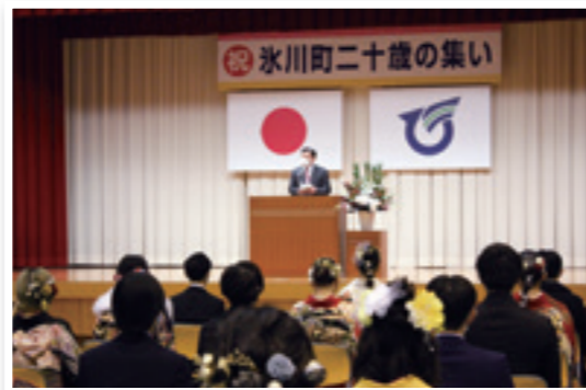
1/3 氷川町二十歳の集い(竜北体育センター)