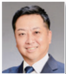
飯田 健二 議員

代市の基準に沿った形でお願いたいです。 議員 持ち込みが出来なくなることで困る人が出てくる。また時間があるので他の対策を検討するべきです。ぜひお願いします。