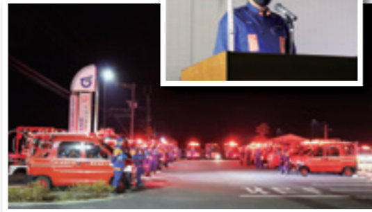
12/28 消防団年末警戒出発式(役場駐車場)