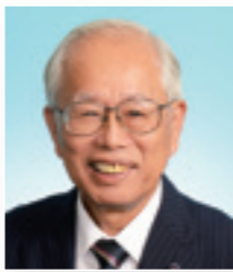
吉川 義雄 議員