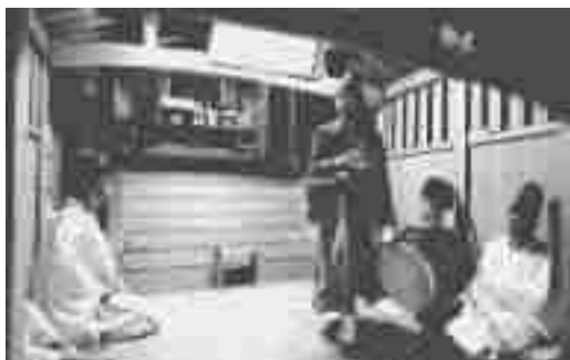
熊野座神社秋祭り