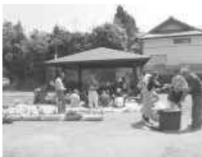
チューリップ祭り