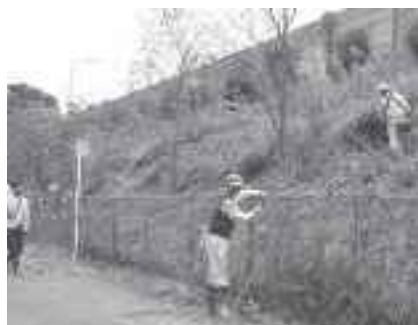
高速道路法面の桜の管理