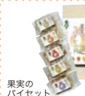
果実のパイセット