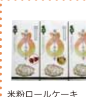
米粉ロールケーキ