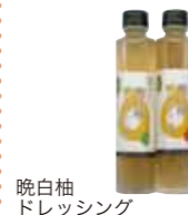
晩白柚ドレッシング