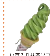
い草入り抹茶ソフト