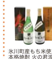
氷川町産もち米使用本格焼酎 火の君浪漫