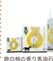
晩白柚の香り馬油石鯛