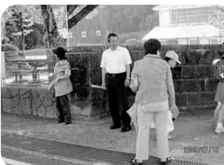
民生児童委員・PTAのみなさんによる朝のあいさつ運動