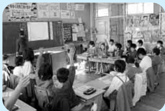
▲人権部落問題学習の授業

人と人が温かくつながり、だれもが居心地よい地域や学校づくり～みんなですすめる人権同和教育の取り組みから～