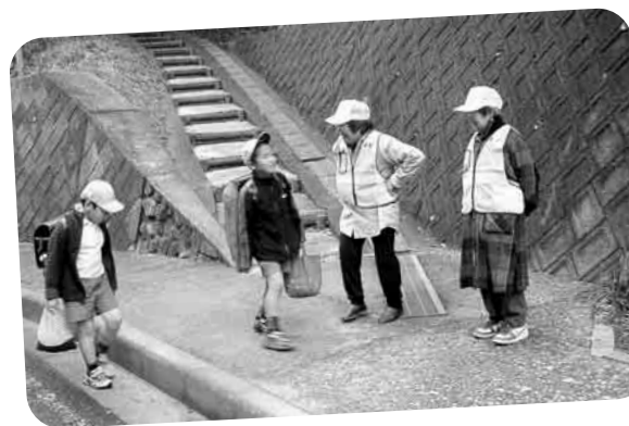
寒い日や雨の日も老人会の皆さんに下校時の見守り運動をしていただいています