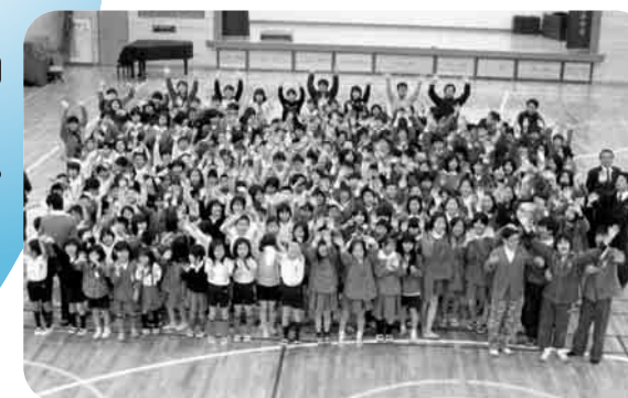
体育館の耐震工事が終わりました