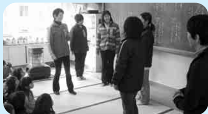
▲人権集会（先生たちの劇）