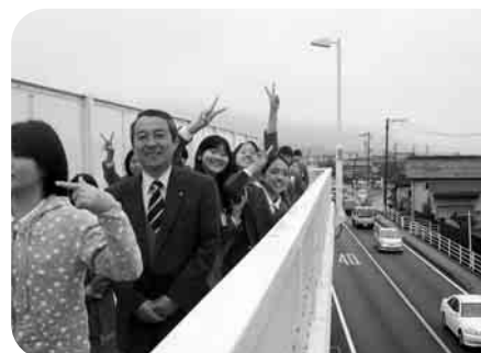
登下校の安全を守るために歩道橋ができました