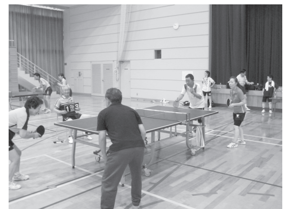
▲楽しく汗をかきました