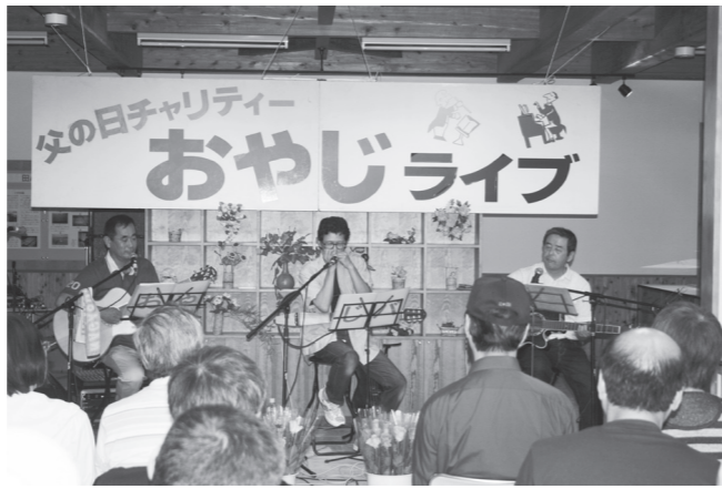
▲トリは「おやじバンド」！！