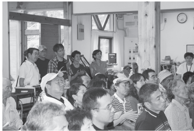
▲リズムに合わせて手拍子！

6月20日、ウォーキングセンターにおいておやじライブ2010が開催されました。 このおやじライブは父の日に合わせて開催されており、今回で12回目となります。今年のテーマは【『邂逅』めぐりあうこと…】町内外の8組の出演があり、雨にも関わらず、会場は満員でそれぞれのバンドの歌声・音色にみなさん耳を傾けていました。