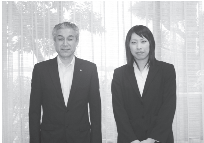
▲町長から激励を受ける野尻さん（右）