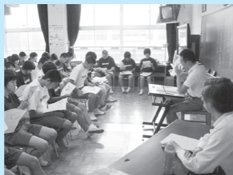
▲みんな熱心に聞いてます

納期内納税者との均衡を保つため納付が遅れた場合は延滞金が付きます。これは法律で定められています。