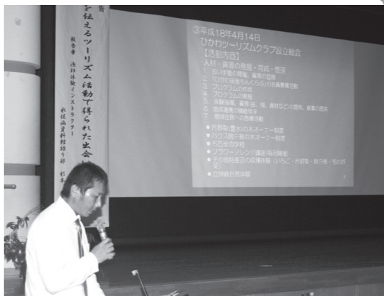
▲山口会長による活動報告