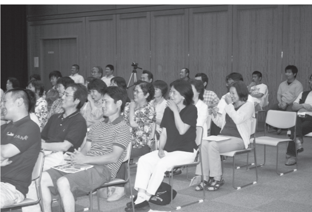
▲涙が出るほどのおもしろさ