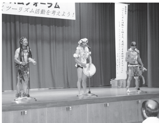
▲やうちブラザーズ 音楽ライブ