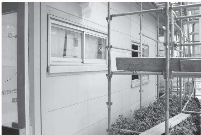
▲6月 ①外壁の工事が始まりました