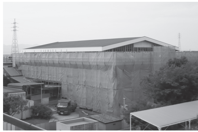
▲5月 屋根が完成しました