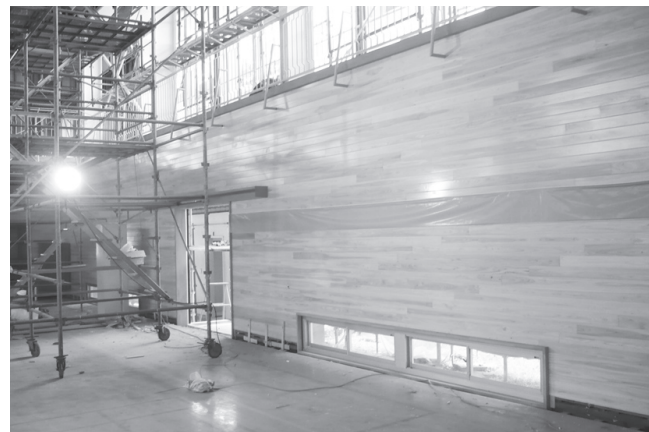
▲6月 ②内部も明るくなりました