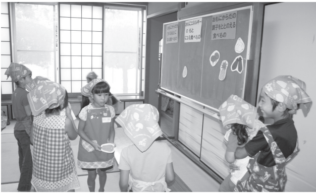
▲どの役割に入るのかなあ？