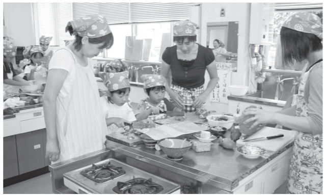
▲上手に調理できました！