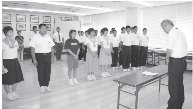
▲藤本町長より激励の言葉