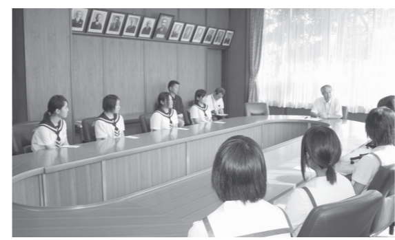
▲それぞれの選手より抱負が述べられました