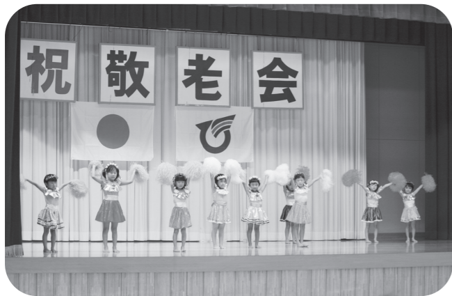
▲元気に踊りました

当日は、天候にも恵まれ両会場とも約300人の参加があり、お祝いの式典、各種団体のアトラクションまで楽しく参加されていました。