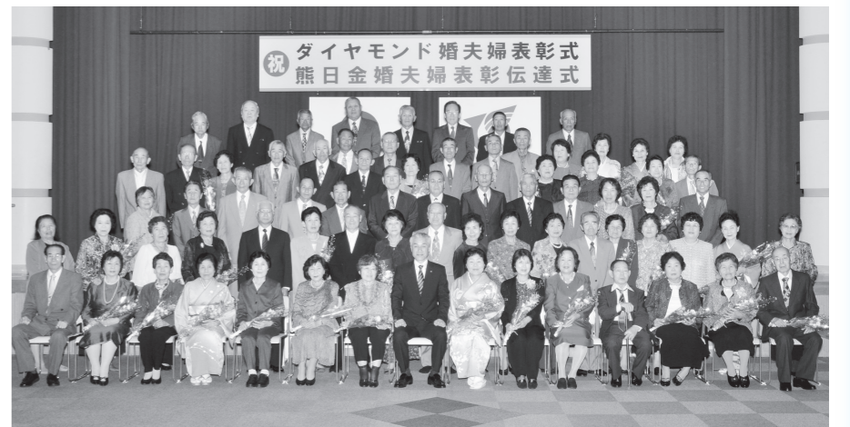
▲金婚、おめでとうございます