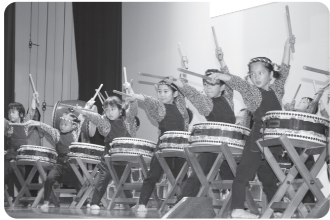
▲バッチリ決まっています!