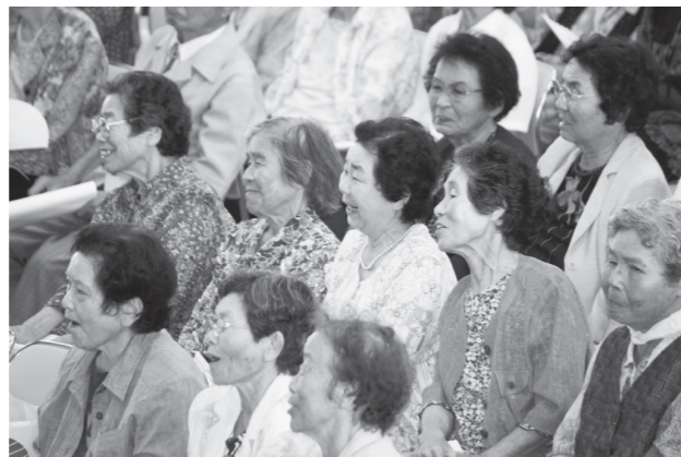
▲会場は笑顔でいっぱい