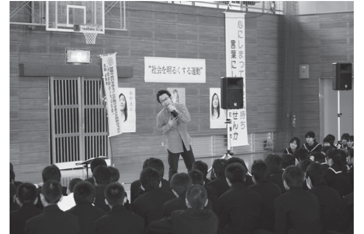
▲むたさんによるライブ

むたさんによるトーク&ライブでは、自らの体験や人との出会いで感じた命や絆、友情の大切さを歌に込めて、生徒たちに届けられました。