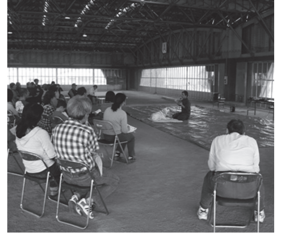
▲愛情を持って育ててください

最後に、参加者から「ムダ吠えが多い」「散歩中に引っ張る」などの相談があり、終了後も個別に相談に応じられました。