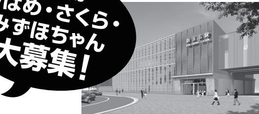
新玉名駅 外観イメージ