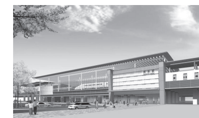
熊本駅 外観イメージ