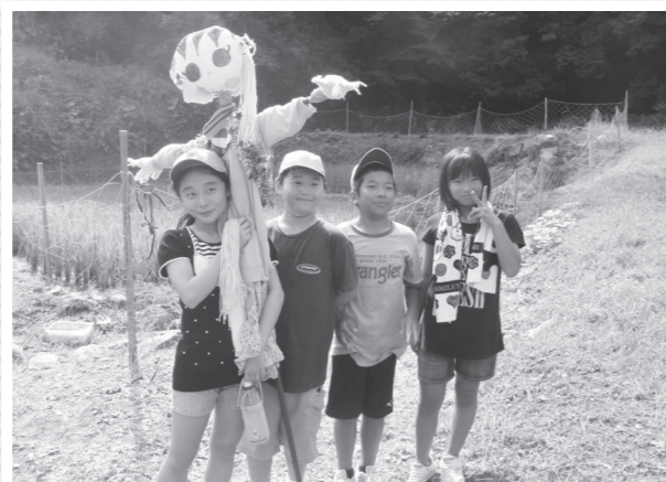
▲自然塾では米作りも自分たちで！！

4月より小学低学年対象の日曜学校「里山自然塾」が始まります。 ～なかまと育む。暦とあゆむ「里山自然塾」。 野遊びと野良しことの一年～ （毎月3回、日曜日、23年4月～24年2月の通期制）