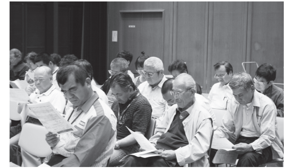
▲説明に耳を傾ける参加者