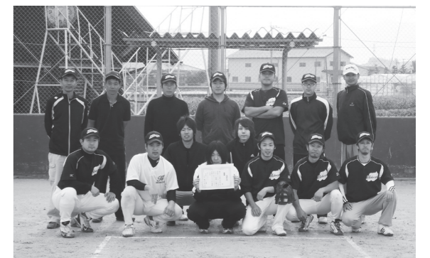
▲優勝した北竜チームの皆さん

注目の決勝戦は、北竜チームと竜北クラブBの対戦となり、北竜チームが6対0で勝利し、2年ぶりの優勝を果たしました。