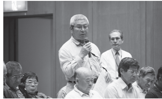
▲活発な意見交換が行われました

5月9日から、町内13会場において町政懇談会が行われ、延べ400人を超える参加がありました。今回の懇談会では、「氷川町中心市街地再整備計画」や「ごみ処理の広域化」などについて町から説明があり、質疑応答では、町政に対する皆さまからのご質問やご意見を多数いただきました。今回、いただきました貴重なご提言等は、検討し、今後の町政運営に役立たせていただきます。なお、当日の会議録は、各区長さんに配布いたしますので、ぜひご覧ください。