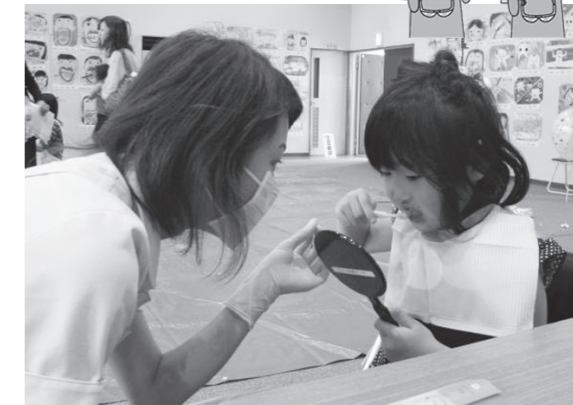
1歳の記念に石膏で足模型を作りました♪

歯科衛生士さんがお口に合った磨き方を丁寧にお話しされました。 フッ化物塗布も無料で受けられ、歯もピカピカになりました。