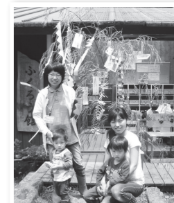
▲どんなお願いをしたのかな？