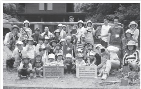
▲おいしいじゃがいもがどっさり！

蝉の声が聞こえ、夏の訪れを感じ始める7月、森のようちえんでは、じゃがいも掘り・さつまいも苗植え・七夕などの行事を行いました。 じゃがいも掘りは、子どもたちだけでなく、お父さん・お母さんも楽しく収穫をされ、さつまいもの苗植えでは、じかに手で穴を掘り「おいしくなーれ」とみんなで願いながら苗植えを行いました。 土と触れ合い、楽しみながら食を学ぶ一環として、今後も森のお散歩と併せて活動を行う予定です。 また、木・土・日は、ふくろう館の子育て支援ルームが利用できますので、お気軽に遊びにお越しください。