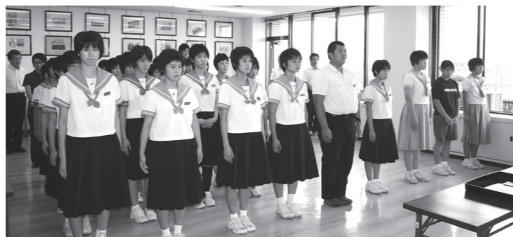
▲それぞれの競技での活躍を誓いました