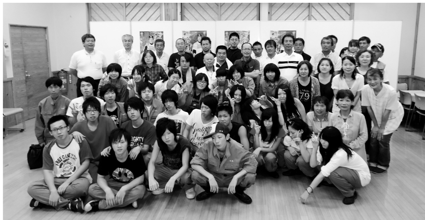
▲実習生と受入農家の皆さん