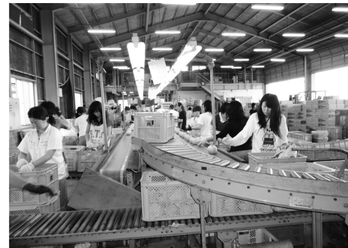
▲梨の選果（吉野選果場）