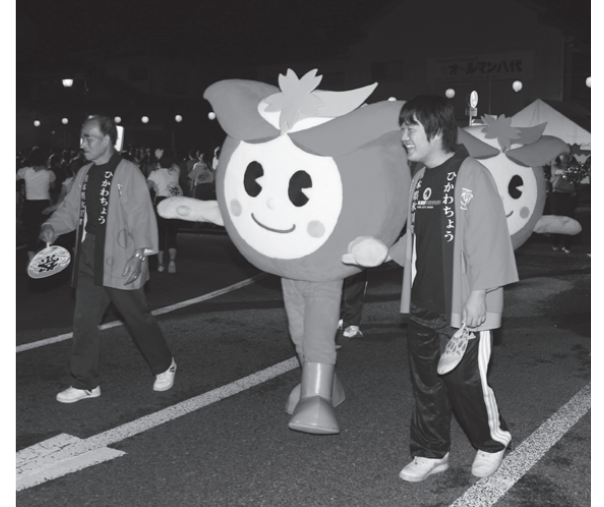
▲氷川音頭も上手に踊ります！

『ひかりん』…氷川町の「ひ」をモチーフに町花である「桜」を配し、情熱的な赤で擬人化。明るく元気な姿をアピールしています。