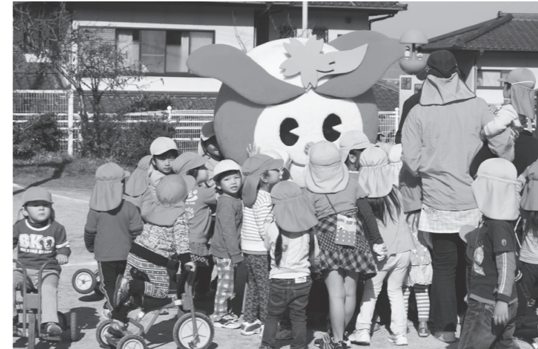
▲子どもたちにも大人気！！