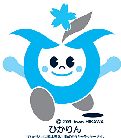
© 2009 town HIKAWA ひかりん 「ひかりん」は熊本県氷川町のPRキャラクターです。

採用作品は氷川町が発行するポスター・パンフレットなどに使用するほか、町特産品などのPR用印刷物としても幅広く活用していきます。 町キャラクター「ひかりん」ともどもよろしくお願ひします。