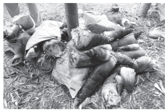
▲こんなに採れました