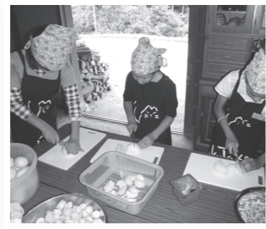
▲おいしくできるかな??