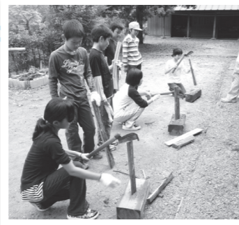
▲初めてのまき割り