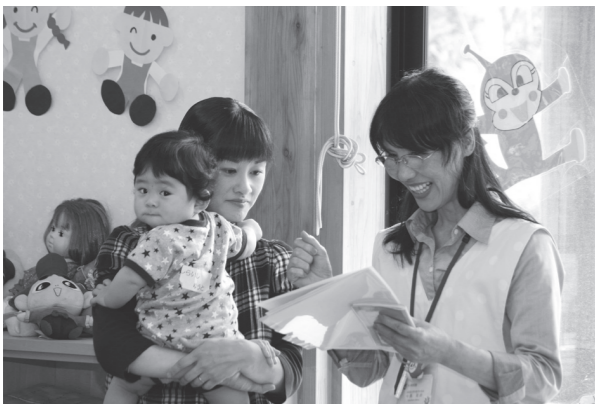
▲これからの成長が楽しみです!

健診では、医師による診察をはじめ、管理栄養士による食事のアドバイス、歯科衛生士によるブラッシング指導、保健師による育児相談が行われ、日ごろの疑問点を質問するなど、お母さんたちは熱心に説明を聞いていました。