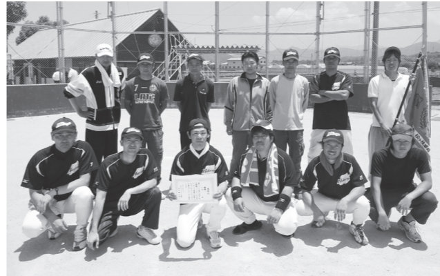
▲劇的優勝!北竜チームの皆さん

この大会は、雨により2年続けて開催が中止となっていました。今年も天候にも恵まれ、町内から5チーム66人の選手が参加しました。