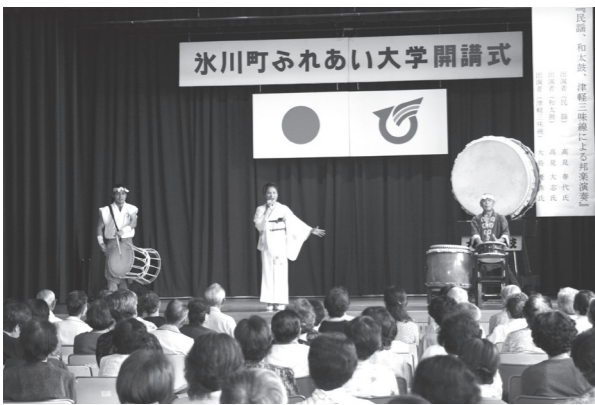
▲楽しいステージに参加者はくぎ付け

最後には、民謡と和太鼓の合奏や津軽三味線の独奏、さらには民謡、和太鼓・津軽三味線の合奏もありました。