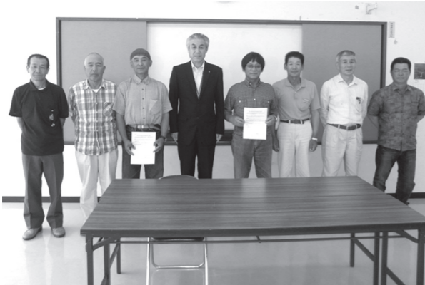
▲協定書を交わした2団体