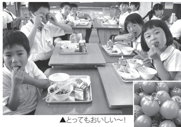
▲とってもおいしい~!

このミニトマトは、この日の学校給食のデザートメニューとして子どもたちに届けられました。