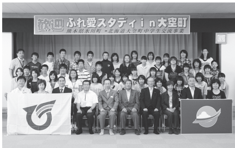
▲平成24年度 ふれ愛スタディ in 大空町