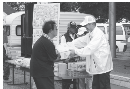
▲抽選会では梨のプレゼントも