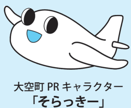
大空町 PR キャラクター「そらっきー」

友好町村提携前の平成9年からは、中学生を対象とした「ふれ愛スタディ in 東藻琴」がスタートし、そのほか議会をはじめ、各種団体、役員職員の相互交流など、これまで延べ500人以上の人的交流を行いました。