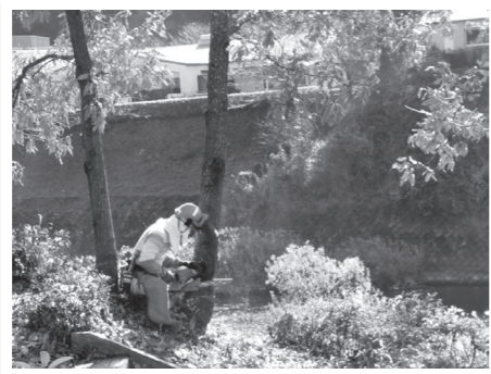
▲ほだ木用クヌギを伐採