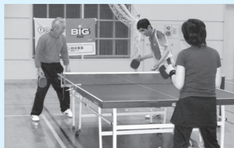
▲気軽に参加できる卓球!

ロンドンオリンピック女子団体によるメダル獲得の記憶が新しい卓球を、身近に楽しく競技できる場として皆さんに参加していただいています。多くの方に参加していただけるよう、時間帯を2パターン設定して開催しています。ぜひ遊びに来てください。