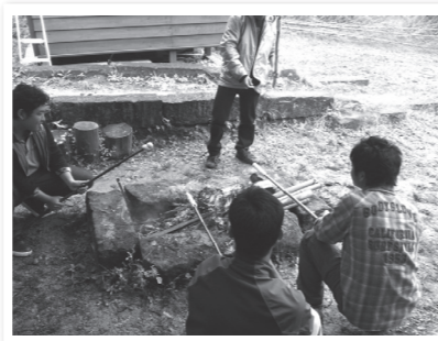
▲早く焼けないかな