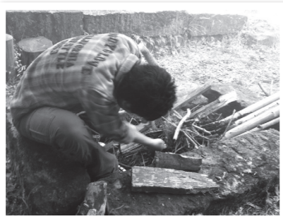
▲ちゃんと燃えますように