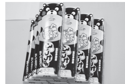
▲もう食べた?晚白柚ぷっちょ