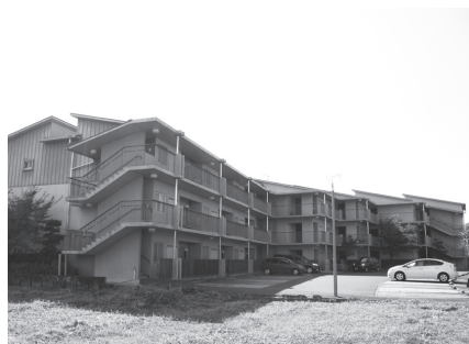
▲JR有佐駅から徒歩3分