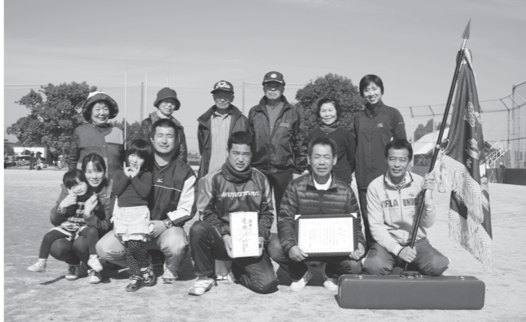
▲グラウンドゴルフの部優勝：北鹿野地区館

どほかのチームを圧倒した北鹿野地区館が優勝を飾りました。 また、室内で行われたカローリング競技の部では、最終投で形勢を逆転するミラクルショットが飛び出す場面もあり、歓声が上がりました。 両競技共に笑顔溢れる楽しい大会となりました。