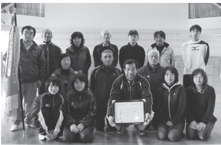
▲カローリングの部優勝：柳の江地区館