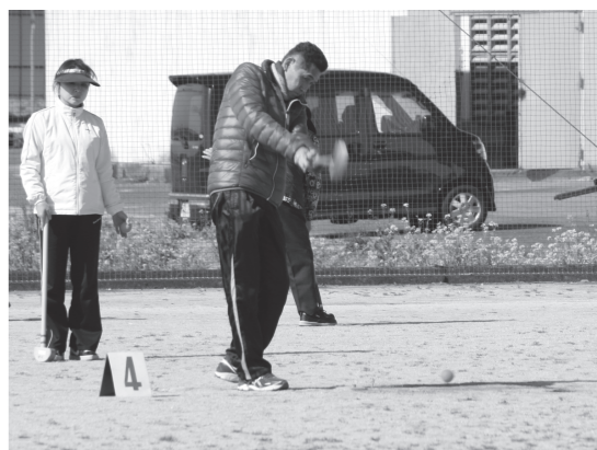
▲狙うはホールインワン