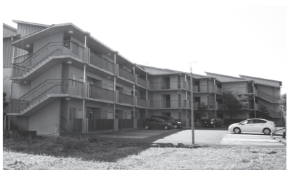
▲JR有佐駅から徒歩3分

また、所得が基準に満たない場合は、上昇の見込みがあること。このほか、氷川町特定公共賃貸住宅条例などに基づきます。 ◆申込期間 随時受付中 ◆申込書 建設下水道課および宮原振興局総務振興課にあります。また、氷川町のホームページからダウンロードも可能です。