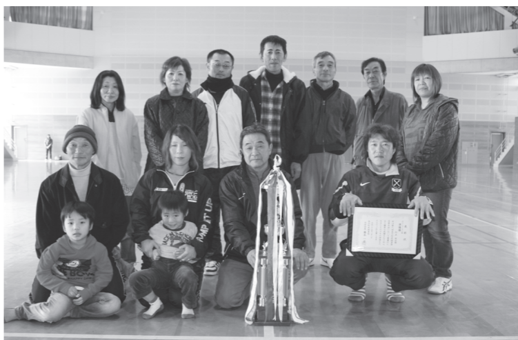
▲カローリングの部準優勝：川上地区館

【グラウンドゴルフ競技の部】 優勝：北鹿野地区館 準優勝：南鹿野地区館 3位：樽地区館