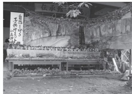
特別賞 伝承館陶芸クラブ 「自然を守る子どもサミット in 立神峡」