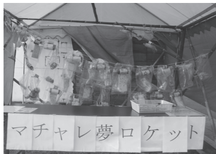
特別賞 総合型氷川スポーツクラブ 「サマチャレ夢ロケット」