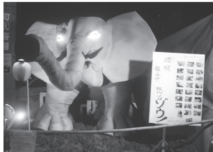
議長賞 造り物好きもん会 「増税値上げ怒るゾウ!」