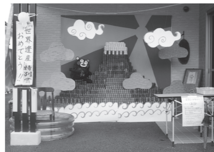
特別賞 グループホーム・デイサービス花音 「『世界遺産』おめでとう!!」