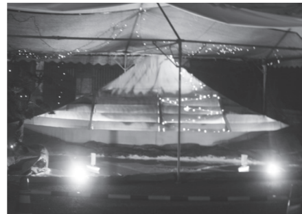
町長賞 ひかわアワーズ 「霊峰富士」