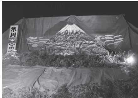
観光物産協会会長賞 河原町内会 「氷川富士」