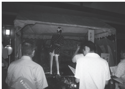
特別賞 宮原を語る会 「氷川の海女ちゃん大野窟古墳に潜る」