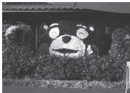
特別賞 デイサービス木香 「くまモン」