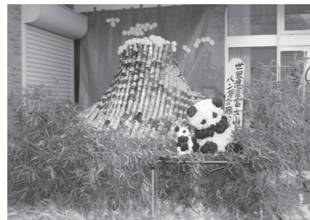
特別賞 小規模多機能 桜ヶ丘別荘 「世界遺産富士山とパンダへの願い」