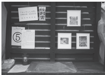
特別賞 氷川町青年団 「コーフンした!?大野窟古墳、国指定記念」