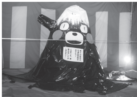
特別賞 ファーストチーム 「くまモン富士」