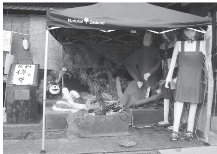
特別賞 まちづくり酒屋 「みーんななかよし 干支の巳〜ちゃん」