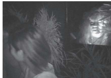
商工会長賞 氷川町立地球防衛隊 「おばけ屋敷」