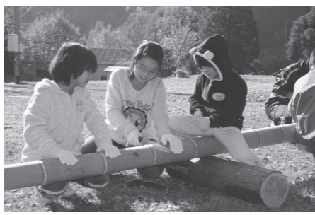
▲竹を切るのも新鮮な体験

正月の風物詩「門松」づくり 立神峡でミニ門松づくり 12月8日、立神峡公園において、ミニ門松づくりが行われ、5家族13人の参加がありました。参加者らは公園内で採られた竹を使って、門松の中心となる竹は縁起が良いとされる「笑い口」の形になるように切り、思い思いに飾り付けをするなどして、それぞれの門松を作り上げました。門松は神様が宿られる場所で、新年に下界に降りて来られた時に、お迎えするための目印と言われています。現在では見掛けることが少なくなった門松ですが、それを作るという作業は子どもたちにとって、文化と伝統を知る貴重な体験となったようでした。