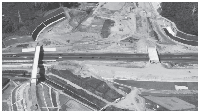
▲スマートIC周辺工事の様子

スマートICに関しては、平成26年3月の開通に向け、高速をまたぐ橋が完成し、車両が通行する土台の工事などが急ピッチで進められています。 アクセス道路に関しては、スマートICの開通に合わせて、スマートICから東側の工事（上図太線①の区間）が平成26年3月までに完成する予定で進んでいます。 また国道3号から県道小川八代線までの区間（上図太線②の区間）についても平成26年3