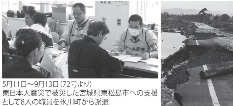
5月11日～9月13日(72号より) 東日本大震災で被災した宮城県東松島市への支援として8人の職員を氷川町から派遣