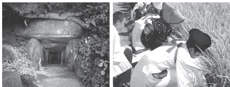
6月21日(94号より) 大野窟古墳が国指定史跡として内定 5月11日ほか(97号より) 献穀事業が行われる(写真は抜穂祭の様子)