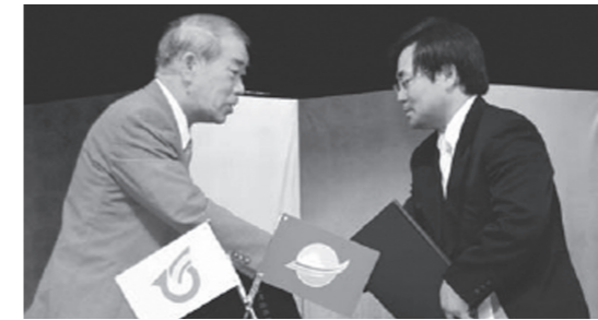
7月9日(10号より) 北海道大空町と友好町提携を締結