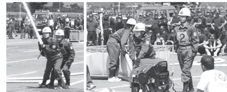
8月24日(36号より) 第27回熊本県消防操法大会で第8分団が優勝