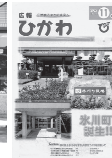
広報ひかわ創刊号