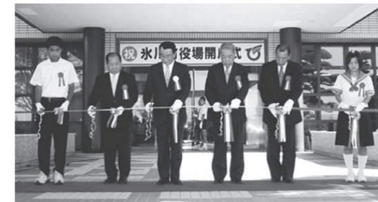
10月1日(創刊号より) 氷川町役場・宮原振興局の開庁式が開催