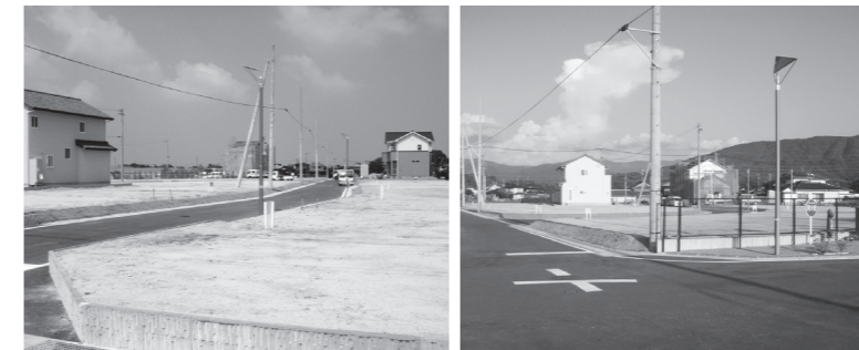
12月17日(26号より) 有佐駅前団地第二期宅地分譲開始