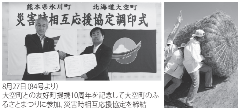
8月27日(84号より) 大空町との友好町提携10周年を記念して大空町のふるさとまつりに参加、災害時相互応援協定を締結