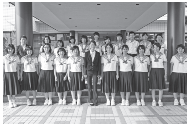
▲竜北中学校吹奏楽部の皆さん