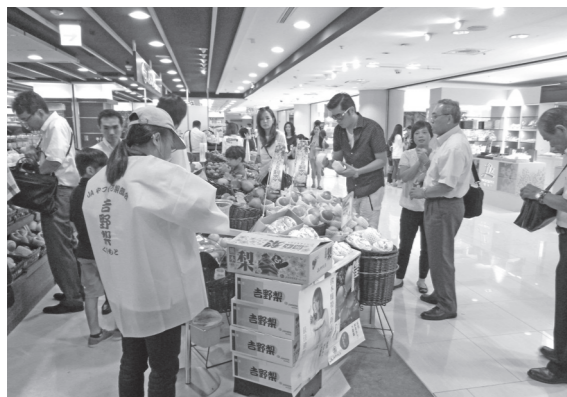
▲台湾のデパートの店頭に並ぶ吉野梨

また、9月6日から8日にかけて生産者代表ら7人が台湾へ行き、台北、高雄にて販促活動を行いました。