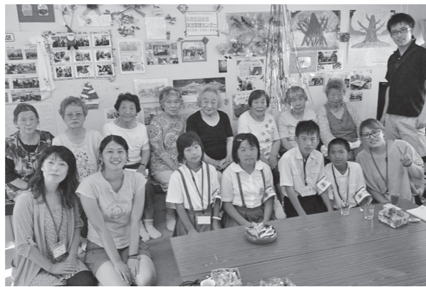
▲大船渡市の仮設住宅を訪問

たことで感じた、震災当時の様子や復興の状況などの説明が行われました。最後に研修参加者からは「命があるのは当たり前ではないことを実感した」「今回の研修で学んだことを多くの人に伝えていきたい」などの感想が述べられました。