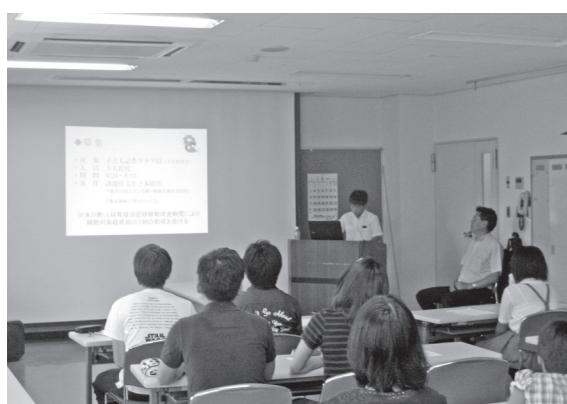
▲スライドを使って説明

この研修は、熊日宮原販売センターが主催し、7月29日から31日までの3日間の日程で実施されたもので、町の人材育成派遣研修助成金を活用し、4人の小中学生が東北を訪れました。 報告会では、スライドを使って研修の様子が報告され、その中では、昨年宮原小学校の児童がみかんを送った岩手県大船渡市の仮設住宅を訪問し、温かい歓迎を受け交流を深めた様子や、陸前高田市で行われている、巨大ベルトコンベアによる平地の高上げ作業や、奇跡の一本松を目の当たりにし