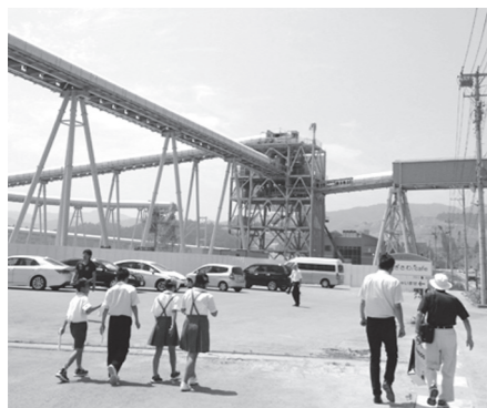
▲1日10t ダンプ5,000台分の山土を運ぶベルトコンベア