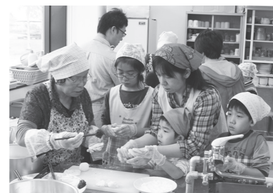
▲北海道大空町と料理を通じて交流

氷川町担い手女性グループは、町内の女性農業者を中心に構成され、女性の視点を生かした活動を通して、農業振興を目指しています。 11月6日、いろいろな植物を同じ鉢に植えて彩る園芸手法の一つである、寄せ植えの研修が行われました。 講師の指導を受けながら、パンジーやビオラなど、気に入った花を鉢に植える会員の皆さん。十人十色の小さな庭が出来あがりました。 また、この日は「花いっぱい運動」の一環で、20個のプランターにも花が植えられ、町内の施設へ配られました。