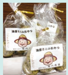
▲自社農場で無農薬栽培したゴマを使用