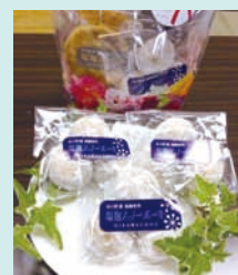
▲地元老舗醤油屋の塩麴を使用

これは、首都圏流通関係者による市場性・固有の魅力・味の優位性・地域特性などについての審査と人気投票を行うもので、県内から出展された37点の中から入賞し「肥後もっこすのうまかもん」として認定されました。