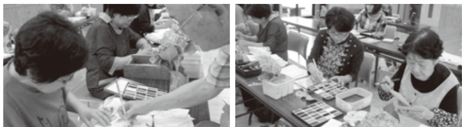
▲先生の丁寧なご指導が入ります。 ▲制作中は、皆さん真剣です。