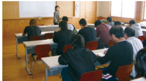
▲農業経営能力向上研修会