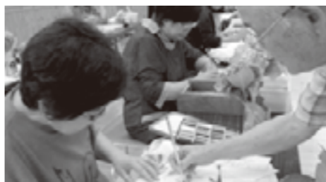
▲先生の丁寧なご指導が入ります。

※ たくさん作品が出来上がったなら、野津交流館で展示会をしたいと意気込んでいらつしやいます。