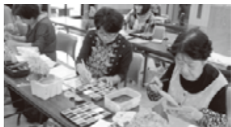
▲制作中は、皆さん真剣です。