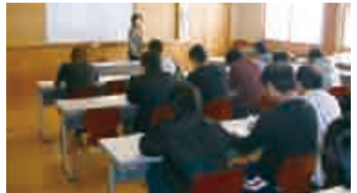
▲農業経営能力向上研修会