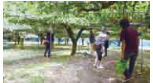
▲異業種交流会 (梨狩り)