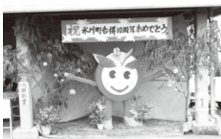
特別賞 河原町内 有志「ひかりん」