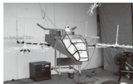
商工会長賞 ロボットクラブ「巨大ドローン」