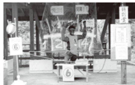
特別賞 町区消防「短距離界に現れた新星 サニブラウン・アブデル・ハキーム」