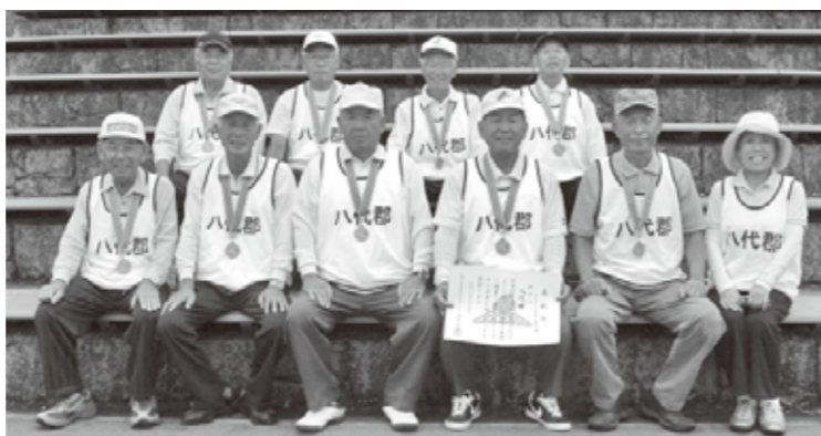
▲グラウンドゴルフ男子の選手の皆さん