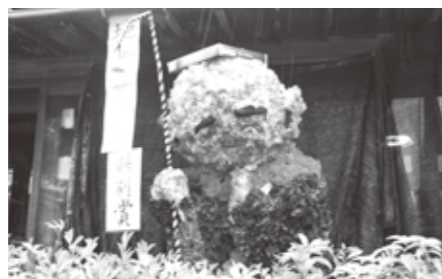
特別賞 デイサービス木香「地藏さん」