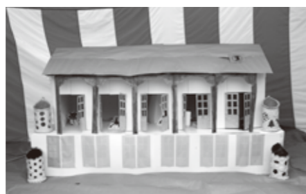
特別賞 氷川町商工会「世界遺産」