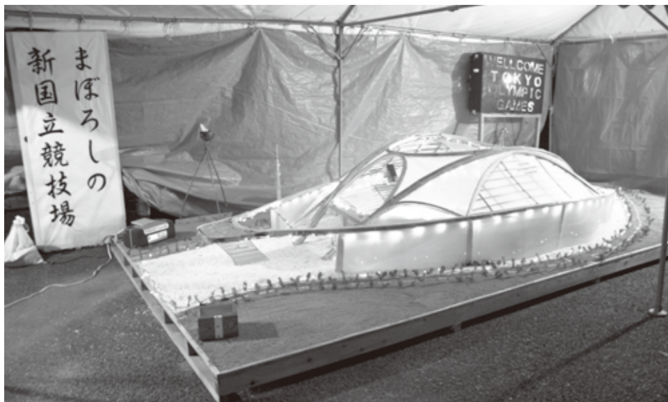
町長賞 西上宮アワーズ「まぼろしの新国立競技場」