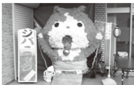
リュウケンホーム賞 桜ヶ丘別荘「妖怪ウォッチ ジバニャン」