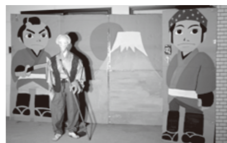
特別賞 デイサービス オアシス「水戸黄門」