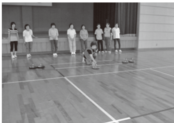
▲一投一投に注目が集まりました