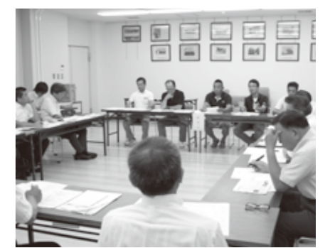
▲販促促進活動に向け議会との勉強会も開催

熊本県は平成25年に「くまもと県南フードバレー構想」を策定し、県南地域の農林水産物を生かした展開を進めています。課題の一つである生産品の販路拡大に向け、部会には12年の経験を生かした中心的な役割が期待されます。