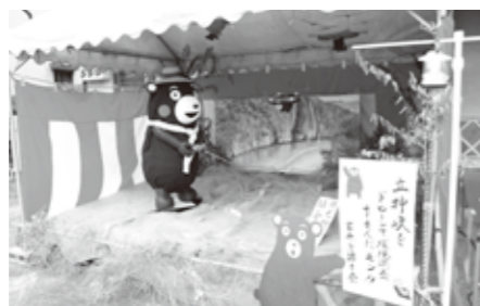
氷川町観光物産協会賞 宮原を語る会「立神峡をドローンで環境調査するんだモン!!」