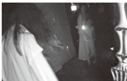
議長賞 お化け屋敷実行委員会「おばけ屋敷」