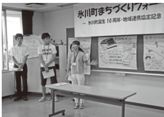
▲知恵を絞り政策提言

大学教授やインターン生、町職員など約40人が参加。インターン生と町職員による3組が「政策研究所のあり方」「空き家政策」「循環型の地域社会構築(ごみ・資源リサイクル)」の3つのテーマで政策提言を行い、「住民と職員の意識改革が重要」「地方分権から住民分権への転換を」など、活発な議論が行われました。