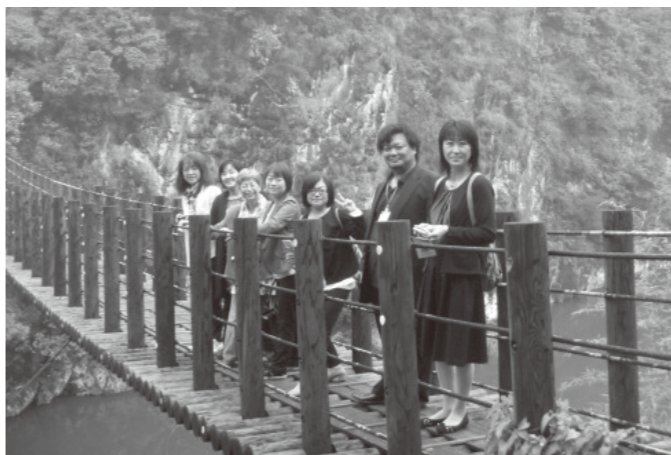
▲立神峡にて 交流団の皆さん

10月9日から11日までの3日間の日程で、友好町である北海道大空町との交流事業が行われました。 例年テーマを掲げて事業を行ってきましたが、今年度は両町共に誕生10周年を迎えることから、お互いの10周年記念イベントに参加することをテーマとし、8人の大空町訪問団を氷川町誕生10周年記念式典にお迎えしました。 式典では、氷川町からイ草のタペストリーが、また大空町からステンドグラスが贈られ、誕生10周年の節目を共に祝いました。