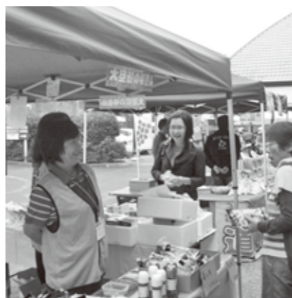
▲道の駅「竜北」での特産品販売

また期間中、道の駅「竜北」での特産品の販売や、梨やみかんの収穫体験などを行い、北海道とは異なる氷川町の環境や文化・農産物などを改めて感じてもらいながら、多くの人との交流を深められました。 今後も交流の輪がさらに広がるように、この交流事業を継続して、交流を深めてまいります。