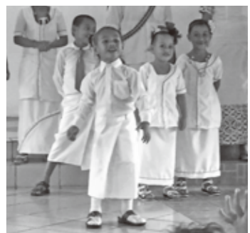
ホワイトサンデーのようす

買ったばかりの真新しい白い服に子どもたちが身を包む姿から「ホワイトサンデー」と呼ばれるようになったそうです。