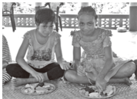
ごちそうを味わう子どもたち

午前と午後の部に分けて、教会でお祈りと子どもたちの出し物が行われます。普段は大人の方が子どもたちより豪華な食事なのですが、この日だけは大人よりも豪華な食事をします。そして、食後は子どもたちの大好物である、アイスクリームを食べて大満足。その姿を見て、家族もうれしそう。 子どもたちにとって、忘れられない1日になったことだと思います。「我が村、サレラバル村は今日も平和です！」