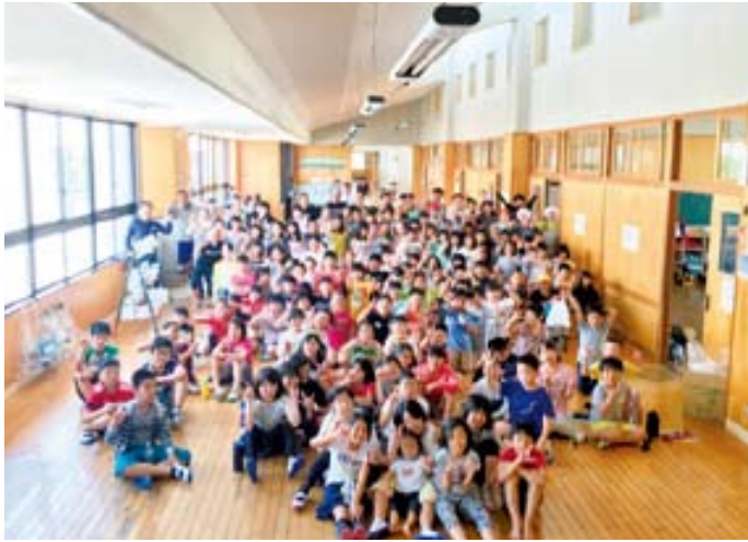
広安西小学校の児童達