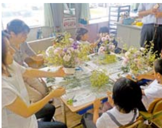
▲上手にできたかな？

花き協会八代支部の皆さんにより、氷川町産のトルコギキョウとスターチスが準備され、児童らは、講師の指導のもと、個性あふれる作品を完成させました。きれいに飾り付けられた完成品は、家族へのプレゼントとなりました。