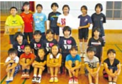
▲高学年の部優勝・下鹿島子ども会