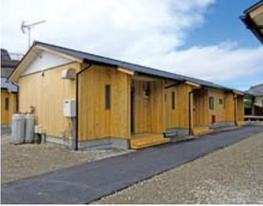
▲生活再建へ向けて

現在、建設中の島地仮設団地については、8月中旬の完成予定で、抽選会により、11世帯の入居が決定しています。