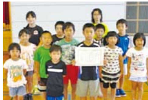
▲低学年の部優勝・早尾子ども会