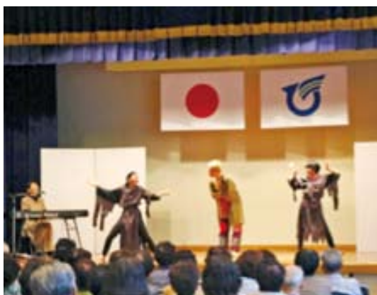
▲ミュージカルに受講生も注目