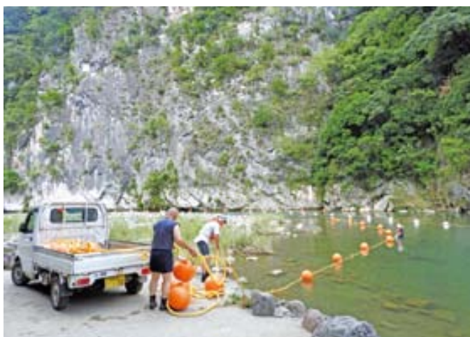
▲救命ブイ設置作業