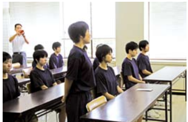
▲抱負を述べる作原主将