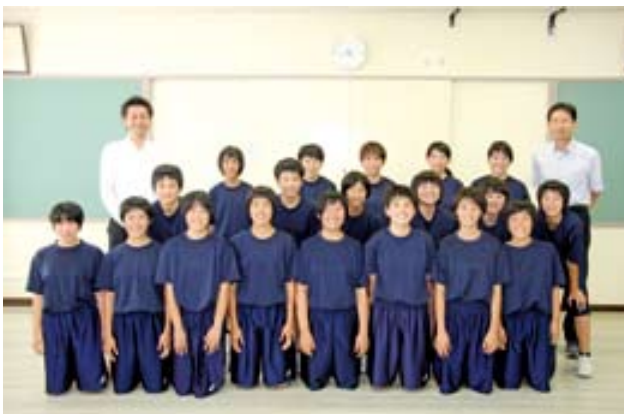
▲九州大会も頑張りました！