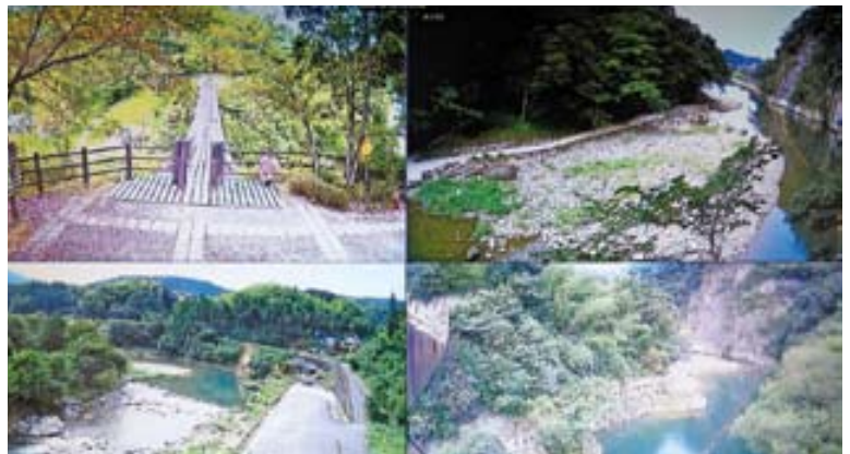
▲防犯カメラで皆さまの安全を守ります

救命ブイは、落石の危険がある岩肌の川沿いに設置しました。水難事故防止に大きな効果があると期待されます。