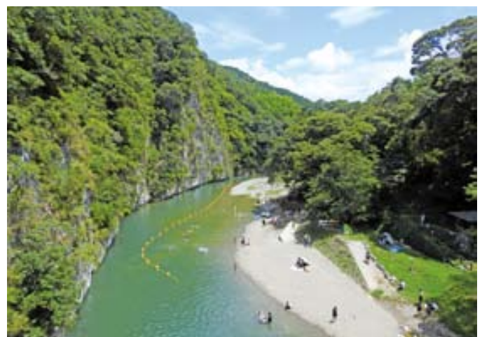
▲より安全に立神峡をお楽しみください