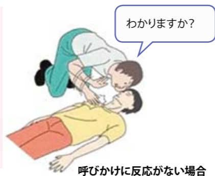
呼びかけに反応がない場合

「大丈夫ですか」など、耳で問いかけながら、肩（鎖骨の辺り）を叩き、意識の有無を確認します。