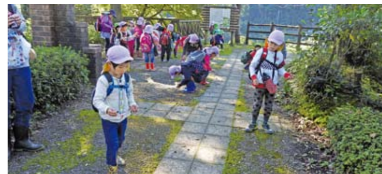
▲どんぐり拾いに園児は夢中