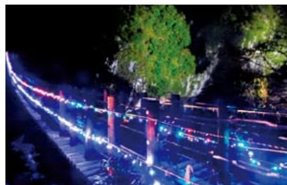
▲夜の立神峡が幻想的な雰囲気