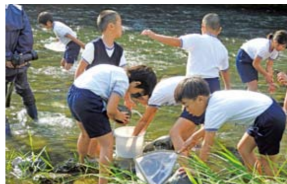
▲石を返して生き物探し

恐る恐る龍神峡の吊り橋を渡る園児たちは、無事に渡り切ると、目の前に落ちているどんぐりを一生懸命に拾っていました。その後は、石絵に使う石を河原で拾いました。楽しい絵がいっぱい描けて園児たちは大喜びでした。立神峡里地公園では、いつでもかわいい園児の訪問を大歓迎しています。