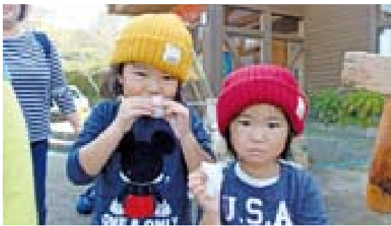
▲美味しいお餅に大満足♪