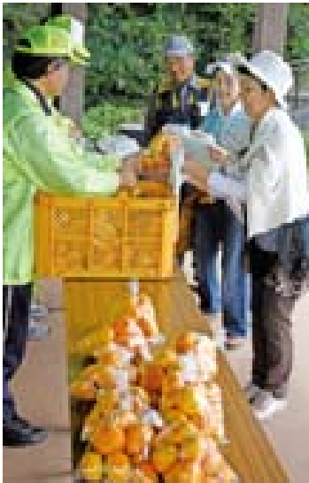
▲参加者には特産みかんのお土産