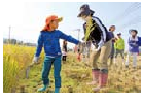
▲親子で仲良く収穫を体験しました