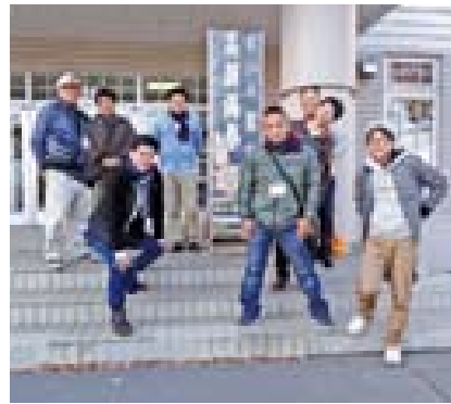
▲東藻琴高校を訪問しました

また、梨部会が農業体験学習で生徒の受け入れをしている東藻琴（ひがしもこと）高校を訪問しましたが、昨年氷川町を訪れた生徒たちとの再会もあり、心温まる時間を過ごすことができました。