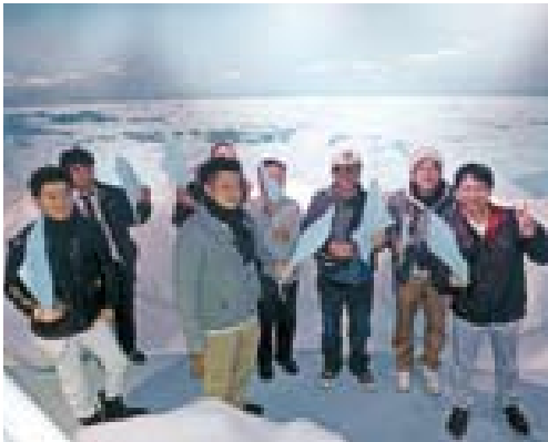
▲-15℃は濡れタオルも凍ります

今後とも事業を通して多くの町民の方が交流を深める場をつくり、友好町として共に支え合い、刺激を受け合う関係を継続していきます。