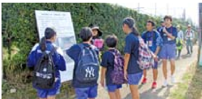
▲大野窟古墳前では古墳の勉強