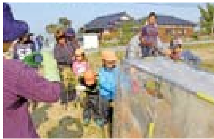
▲千羽扱きを使った脱穀にもチャレンジ