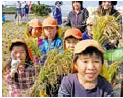
▲たくさん収穫したよ!