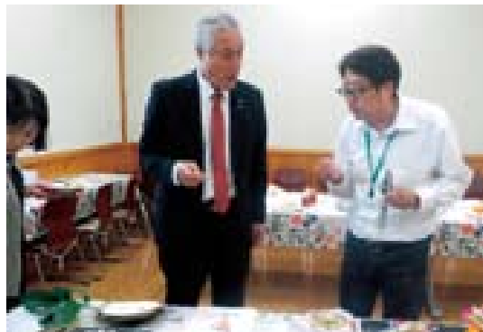
▲美味しい料理に審査も難航