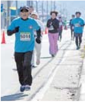
▲もう一息、がんばります！

前日は初雪も降り、少々肌寒さはあるものの、当日は晴天に恵まれ絶好のマラソン日和となりました。全員が5km以上、うち3人はハーフマラソンを走り、ゆるやかな傾斜が延々と続くコースに苦しみながらも、大空町の素晴らしい景色を堪能し、無事完走しました。