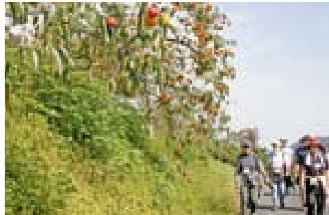
▲秋の実りを感じて

また、昼食では、担い手女性グループにより、豚汁が振る舞われ、参加者たちは氷川町の秋を満喫していました。