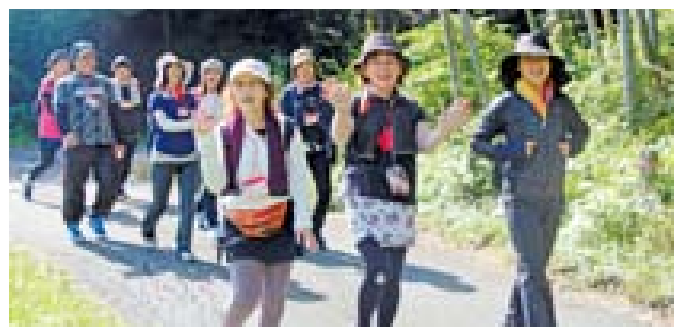
▲自然いっぱい楽しくウォーキング