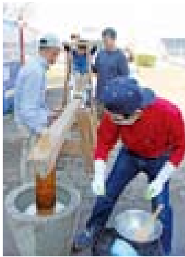
▲子どもたちは全身で餅つきを体験