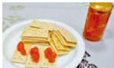
【銅賞】 足立愛実さん(八代市) アップルトマトジャム