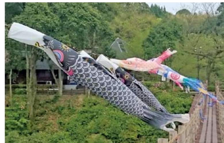
▲龍神橋に泳ぐ鯉のぼり