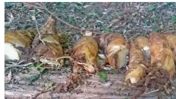
▲春を感じるタケノコ掘りにぜひお越しください